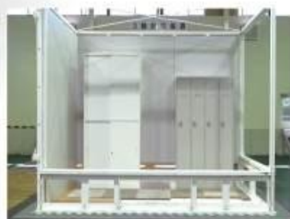
阪神大震災 (JMA神戸波) による耐震性能実証済み ※株式会社ワークパレット振動実験室にて